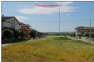
Foto 2 Ante opera