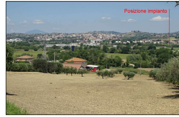
Foto 1 Ante opera